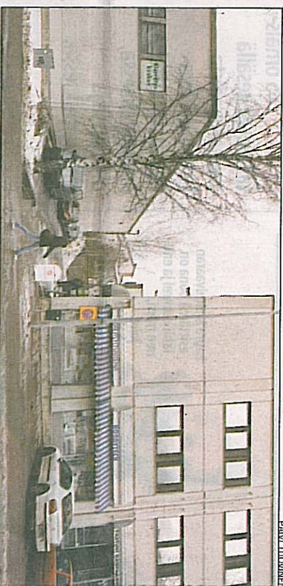
Horsmankujan varrella olevat liikerakennukset joutuvat väistymään asuintalojen tieltä.

Tikkurilantien varteen uusia kerrostaloalueita on tulossa. Uudet kerrostalot sijoitetaan Tikkurilantien varteen uusia kerrostaloalueita on tulossa. Uudet kerrostalot sijoitetaan Tikkurilantien varteen uusia kerrostaloalueita on tulossa.