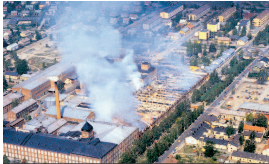
Toukokuussa 1981 tulipalo tuhosi puuvillatehtaan kehräämösosan. Se toimii nyt parkkipaikkana.

Porin Puuvillan perusti 1898 kauppias Gustav Efraim Ramberg, Gustav Rosenlewin äi-